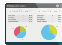
Analyse et contrôle de la fréquentation, marges, rotation des stocks