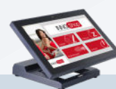
TPV Nino II