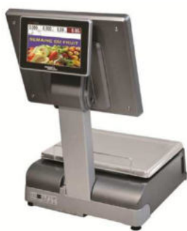
Balance caisse Précia Molen et EXA