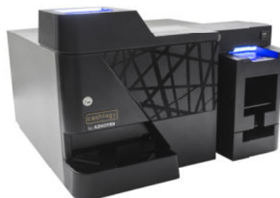
Monnayeur CashLogy Azkoyen