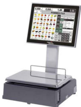
Balance libre- service

Pesage en caisse • Data collecte • Libre-service • Préemballage