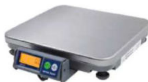
Balance Checkout Mettler ARIVA